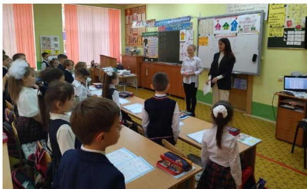
Уроки в начальной школе проводят десятиклассники

Это большой опыт для каждого, который обязательно пригодится в дальнейшей жизни. Как приятно было увидеть, что в кабинетах шла настоящая работа. Малышам (начальной школе) особенно понравились их учителя. Ребята с удовольствием отвечали на вопросы старшекласников, буквально вжившихся в роль педагогов. Надеемся, что День Самоуправления запомнится учителям и ученикам как один из самых ярких и интересных дней нашей гимназической жизни, и пусть эта добрая традиция сохранится на долгие годы.